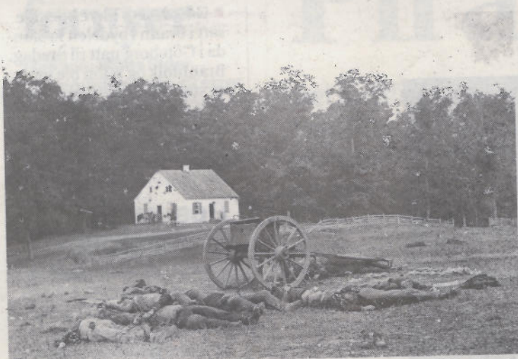
Grusomme scener: Bildene av de døde ved Antietam i Maryland, sørstatene kaller slaget for Sharpsburg, har en sentral plass som minner om den blodigste dagen i amerikansk krigshistorie.